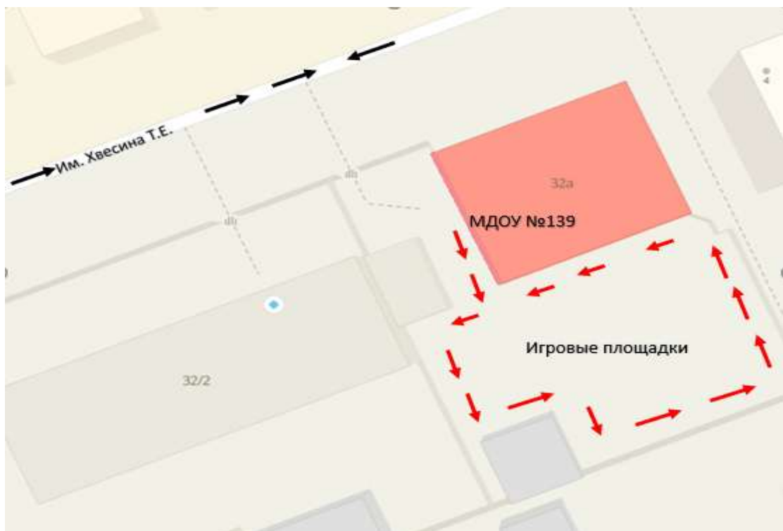
Корпус №2 (г. Саратов, ул. Хвесина Т.Е., 32а)

→ Пути движения транспортных средств к месту разгрузки/погрузки